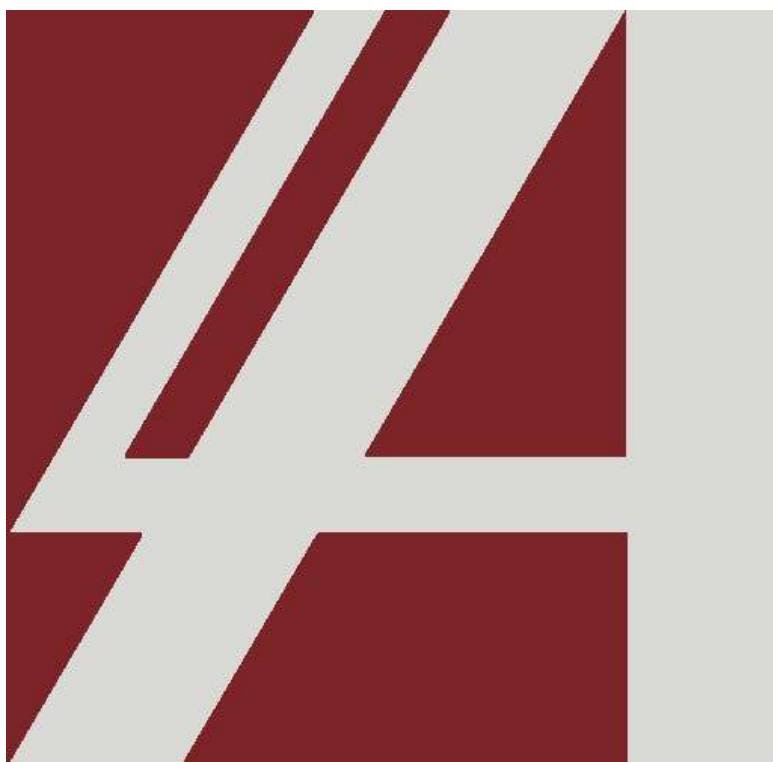
2 pav. Akreditacijos ženklo spalvoto varianto pavyzdys