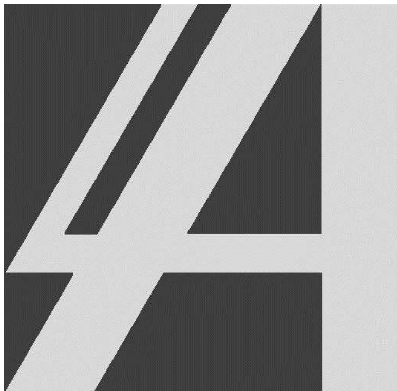
1 pav. Akreditacijos ženklo nespalvoto varianto pavyzdys